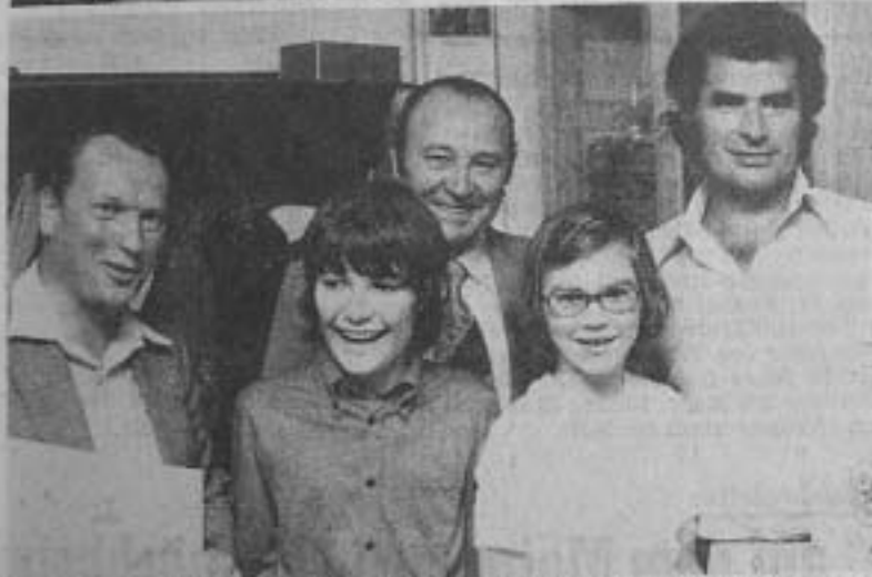
Die Spieler der Meistermannschaft des Schachclubs Höchststadt (oben) und die frischgebackenen Stadtmeister (unten), jeweils mit Bürgermeister Schell.